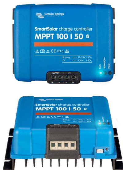
Controlador de carga SmartSolar MPPT 100/50

- Smartphones, tabletas y otros dispositivos Apple y Android - ColorControl GX y otros productos GX.